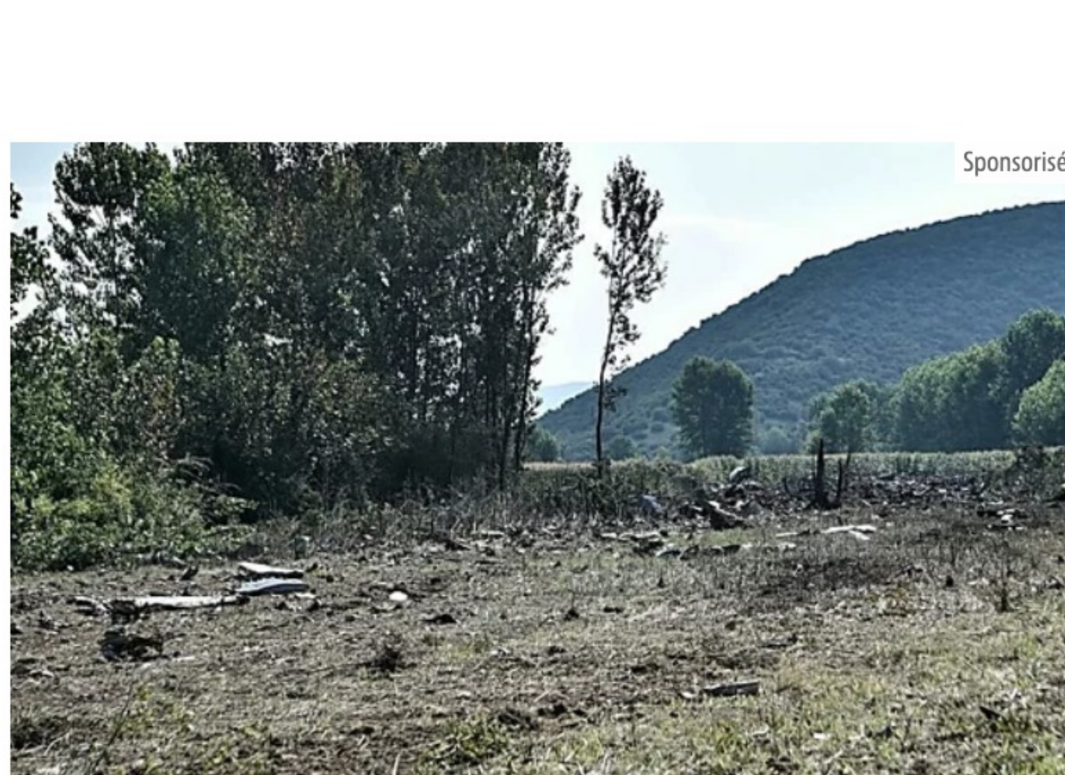
Un avion cargo chargé d'armes fabriquées en Serbie s'écrase en Grèce France 24